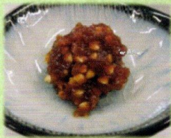
そばみそ (そばの実入り)