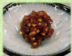
そばみそ (そばの実入り)