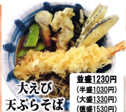
大えび 天ぷらそば

並盛1230円 (半盛1030円) (大盛1330円) (徳盛1530円) 〈各税込〉